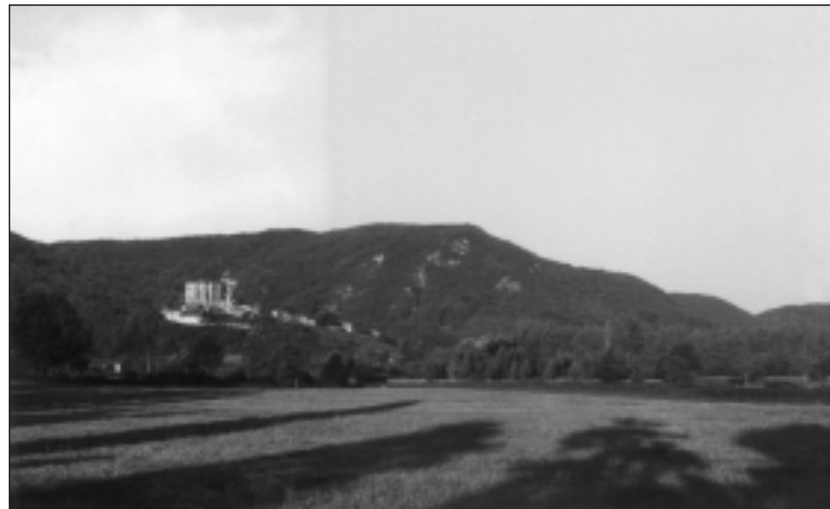
COMMINGES (St. Bertrand) Lugdunum Convenarum Pirine-mendiak