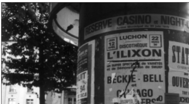
Luchon = LUXON