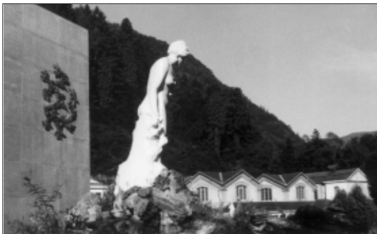
Bagneres de Luchon. Jainkoak: NINFAK eta ILLARGIA Balneum Lixonense.