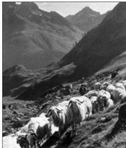
Pireneetarako ganadu - bideak. Udaran igo, neguan jetxi.