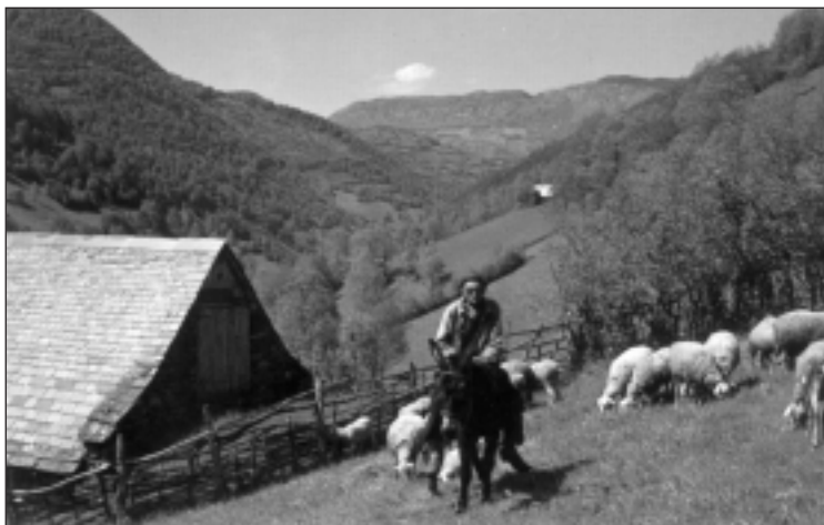
Udarako sarobe eta belardiak. Jainkua: ASTO ILLUNO