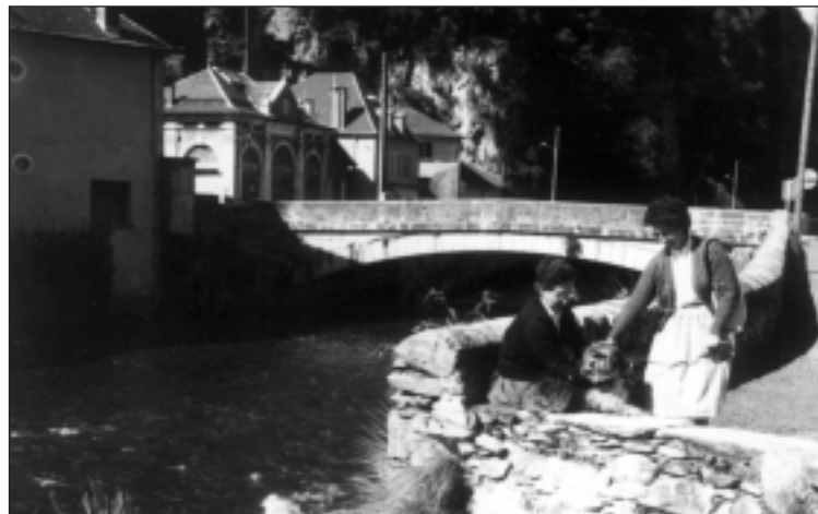
Sr. BEAT Bere inguruan daude Jainkoak: Baicorixo Abel(i)on ILLUMBERI GAR...